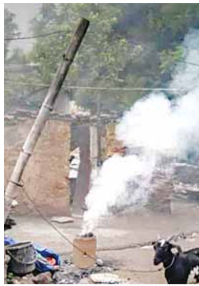
अमले की आवाजाही बनी रहती है। इसके बावजूद न तो किसी होटल संचालक पर कार्रवाई होती है और न ही कोयले के स्रोत को लेकर कोई जांच की जाती है। धुएं से बिगड़ती दृश्यता, बढ़ता खतरादोषहर बाद से घरों की सिगड़ियों और

होटलों की भट्टियों से उठने वाला काला धुआं पूरे नगर को अपनी चपेट में ले लेता है। शहडोल-अमरकंटक मार्ग और अंदरूनी सड़कों पर दृश्यता इतनी कम हो जाती है कि शाम के समय वाहन चालकों को रास्ता तक दिखाई नहीं देता। कई बार