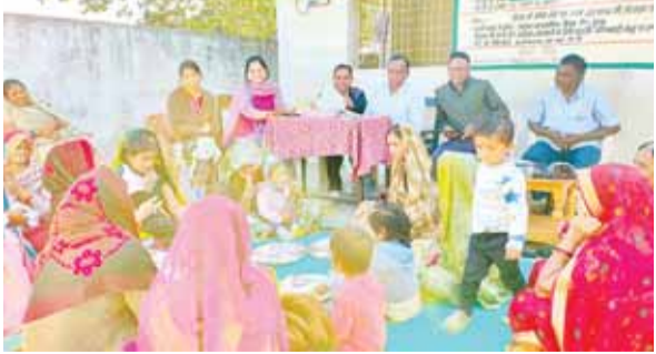
रहा है, पोषण जागरूकता का मुख्य उद्देश्य आमजन में पोषण से जुड़ी भ्रांतियों को दूर करने की पहल की गयी। आयु वार सही पोषण आहार की जानकारी देकर लोगों को स्वस्थ और तंदुरुस्त रहने के बारे में विस्तार से बतलाया गया। बताया गया की कुपोषित माँ कुपोषित बच्चों को जन्म देती है, इसलिए माँ को पहले कुपोषण से बचना है ताकि नवजात शिशु जन्म से ही स्वस्थ और तंदुरुस्त हो, एक स्वस्थ शरीर में ही स्वस्थ मन और विकास करता है। इस प्रक्रिया से धीरे धीरे हम कुपोषण की स्थिति को कम सकते हैं और धीरे धीरे कुपोषण मुक्त परियोजना बनाना है। इसी तारतम्य में आज