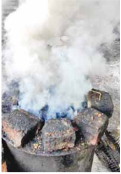
बल्कि खाद्य सुरक्षा और जनस्वास्थ्य पर भी गंभीर खतरा मंडरा रहा है प्रशासन की नाक के नीचे कारोबारहैरानी की बात यह है कि यह पूरा खेल नगर के सबसे व्यस्त चौराहों और बाजार क्षेत्रों में चल रहा है, जहां पुलिस, नगर पालिका और प्रशासनिक

साउथ ईस्टर्न कोलफील्ड्स लिमिटेड (एसईसीएल) द्वारा घरेलू उपयोग के लिए कोयला आपूर्ति पर पूर्ण प्रतिबंध और रसोई गैस की वैकल्पिक व्यवस्था के बावजूद धनपुरी कोयलांचल में कोयले का दुरुपयोग थमने का नाम नहीं ले रहा है। धनपुरी।